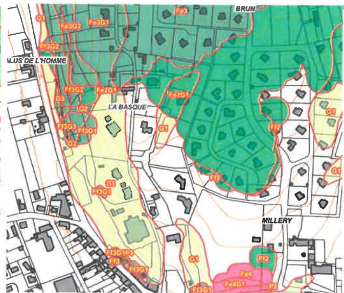
Figure 1: Carte modifiée à substituer

Cité administrative 2 rue Jules Ferry – BP 90 33 090 Bordeaux Cedex Tél : 05 56 93 30 33 Mél : ddtm-upprntt@gironde.gouv.fr www.gironde.gouv.fr