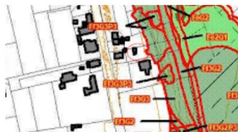
Pac PPRMT - localisation projet.PNG 822K