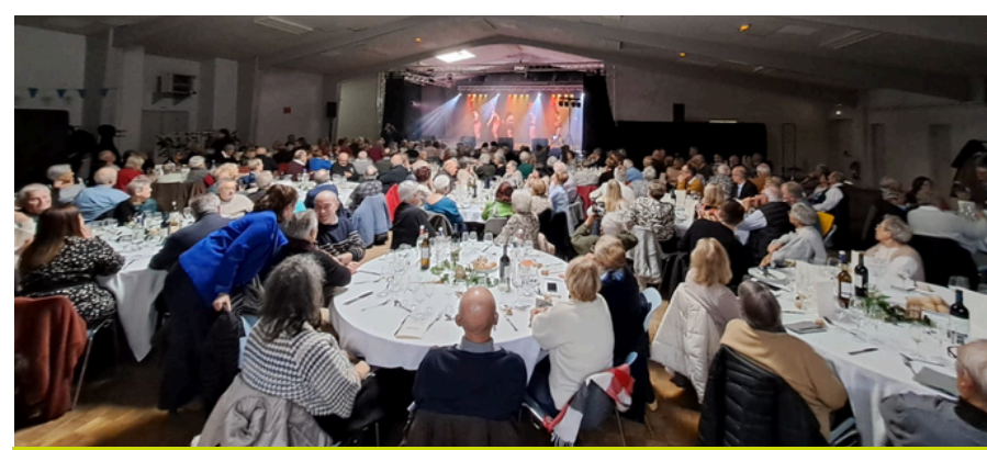
Repas des aînés par le CCAS - janvier