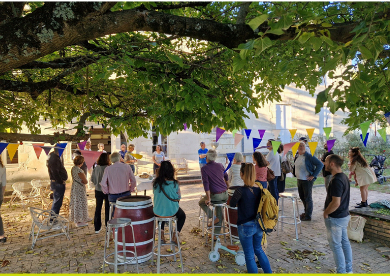
Accueil des nouveaux arrivants - octobre