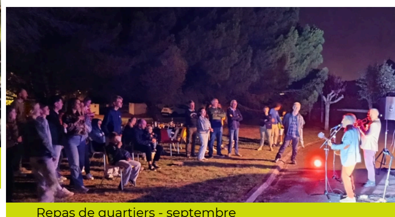
Repas de quartiers - septembre