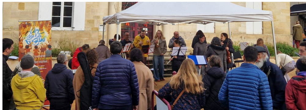
Festivités de Noël, concert de l'Art de la Fugue - décembre