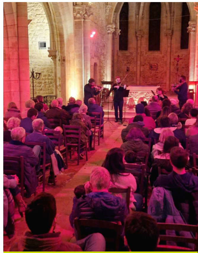
Festivités de Noël - décembre