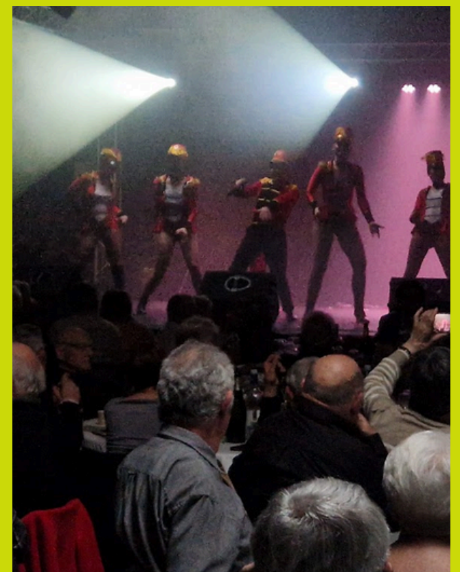
Repas des aînés - janvier

SAMEDI 29 AOÛT A partir de 19h Feux de Garonne