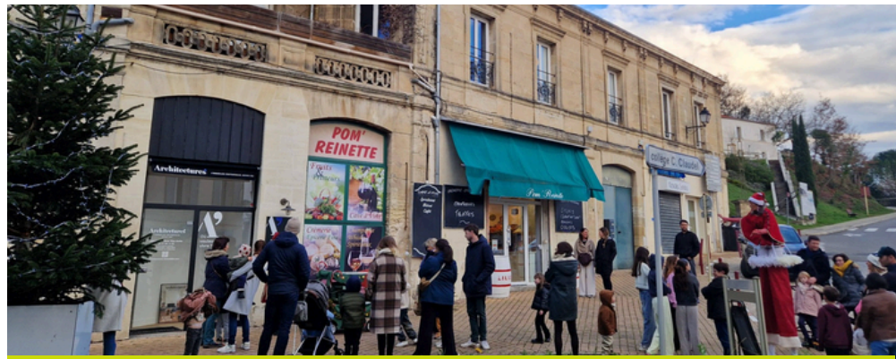
Festivités de Noël - décembre