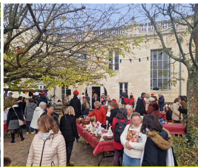
Le Noël de la Fourmilière