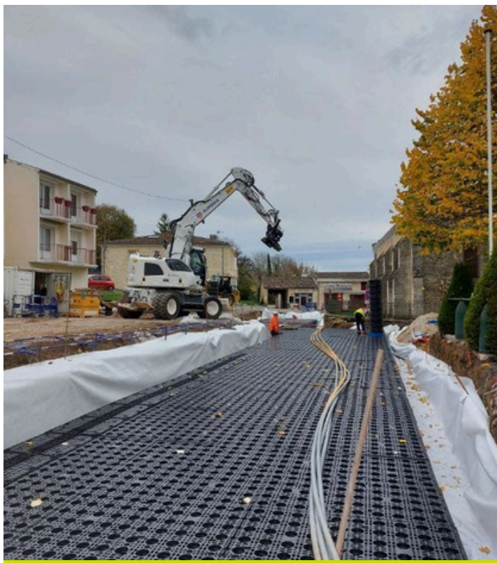
Installation de cuves de régulation des eaux pluviales, place Sainte-Quitterie - novembre