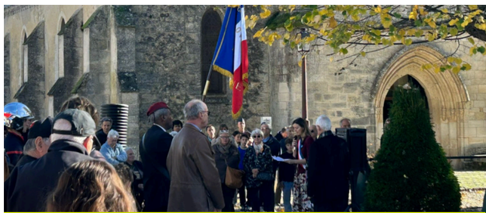
Commémoration de l'Armistice du 11 novembre 1945