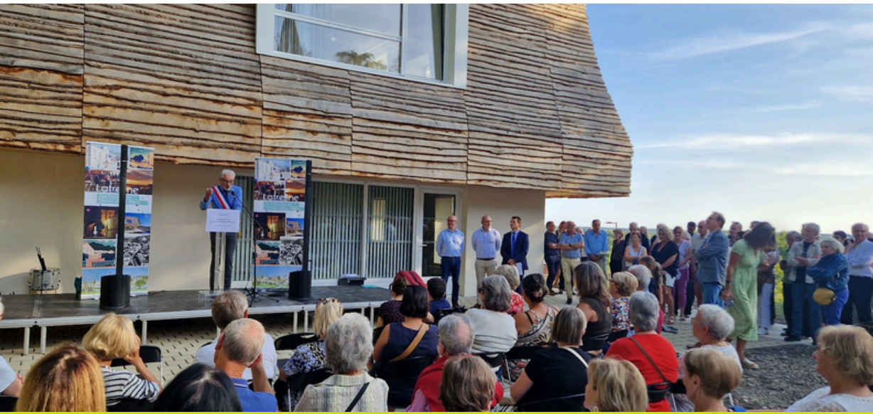
Inauguration du pôle de pratiques artistiques