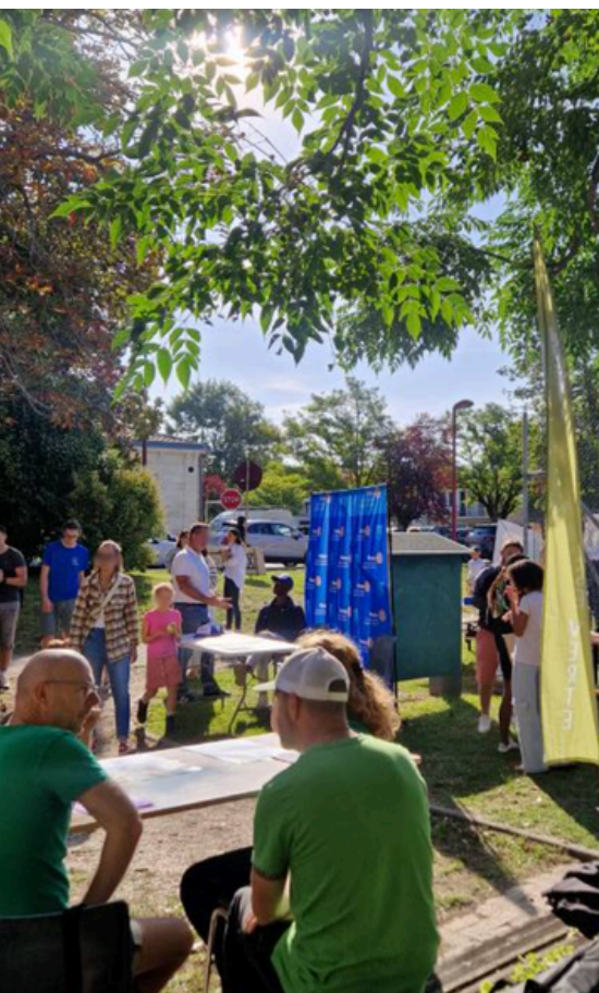
Rentrée de Latresne, forum des associations - septembre