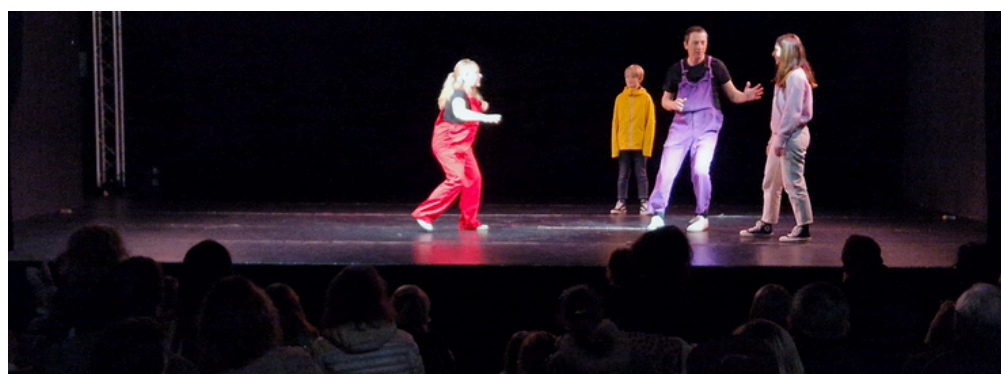
Festival Théâtre d'Hiver, pièce jeunesse - janvier