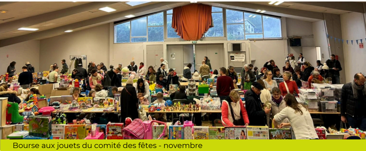
Bourse aux jouets du comité des fêtes - novembre